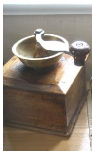
Sadzīvē un saimniecībā lietotie priekšmeti